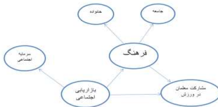
شکل ۱. چارچوب مفهومی

حال با توجه به اینکه در تمامی مقاطع تحصیلی بیش از یک میلیون معلم در جامعه داریم که تعداد فراوانی از آن‌ها در فعالیتهای ورزشی منظم مشارکت ندارند و ضروریات مشارکت این قشر در ورزش نیز از دیدگاه‌های مختلف مورد بررسی قرار گرفت، محققان بر آن شدند که این مهم را از دیدگاه جدید بازاریابی اجتماعی، که دیدگاهی تازه در خصوص مسائل اجتماعی از جمله مشارکت در ورزش دارد و رویکردهای موفق آن در کشورهای توسعه‌یافته عنوان شدند، مورد مطالعه و بررسی قرار دهند و در این راستا به این سؤال پاسخ دهند که کاربرد بازاریابی اجتماعی در ارتقای گرایش معلمان به ورزش‌های همگانی چگونه است؟ و در این راستا با توجه به تحقیقات صورت گرفته در زمینه ورزش‌های همگانی و تفریحی و بازاریابی اجتماعی مدل مفهومی زیر را ارائه کردند.