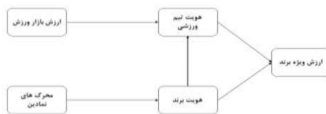
شکل ۱. مدل مفهومی

پژوهش حاضر به طور کلی از چند جهت با پژوهش‌های صورت گرفته متفاوت است. اول اینکه مطالعه حاضر مؤلفه‌های ارزش‌های بازار ورزش و ارزش‌های نمادین را به صورت تجمیع شده و به عنوان سازه‌های مرجع در نظر گرفته است؛ در صورتی که در مطالعه وانگ و تانگ (۲۰۱۸) مؤلفه‌های این متغیرها رو به صورت جداگانه روی هویت اجتماعی (هویت تیم و هویت برند) مورد بررسی قرار داده است. تفاوت دیگر مطالعه حاضر براساس کار وانگ و تانگ (۲۰۱۸) است که هویت اجتماعی را در قالب دو بُعد هویت تیمی و هویت برند مرتبط با تیم در نظر گرفته شده است؛ در صورتی که محققانی مانند واتکینز (۲۰۱۴) هویت را صرفاً در قالب هویت هوادار خلاصه کرده است. در ارتباط با ارزش‌های نمادین نیز مطالعات صورت گرفته عمدتاً ابعاد ارزش‌های نمادین را به صورت جداگانه مورد بررسی قرار داده‌اند؛ در صورتی که در مدل پژوهش حاضر هر سه متغیر تشابه، تمایز و اعتبار برند را در قالب سازه محرک‌های نمادین ارائه شده است. علاوه بر این براساس تئوری هویت اجتماعی در ورزش حرفه‌ای، هویت به دو گونه شناسایی با تیم (هویت تیمی) و شناسایی با هویت برند تیم (هویت برند) قابل تقسیم است، لذا براساس مدل طراحی شده در این پژوهش، ارزش‌های بازار ورزش به عنوان عوامل پیش‌آیندی هویت تیم ورزشی و محرک‌های نمادین نیز به عنوان عوامل پیش‌آیندی هویت برند تیم ورزشی در نظر گرفته شده‌اند. چهارچوب مفهومی این پژوهش براساس مدل هویت تیمی آندورود و همکاران (۲۰۰۱)، وانگ و تانگ (۲۰۱۸) و مدل والتر و همکاران (۲۰۱۶) فرض شده است.